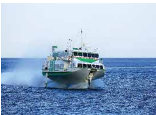
おなじみジェットfoil