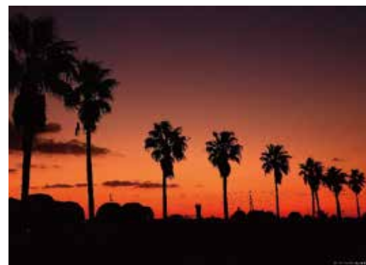
近くの奈良尾交番前から（朝焼け）