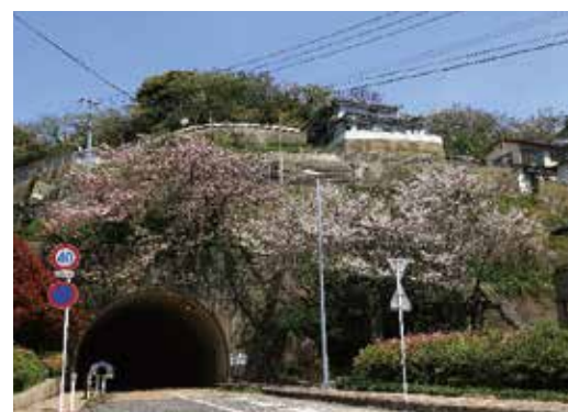
奈良尾トンネルと桜