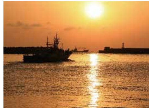
船体が朝日に映えます