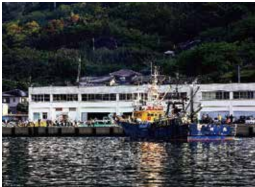
大勢の人に見送られ、出港する巻き網船

今回の奈良尾医療センターコーナーは、当センターから望める素晴らしい風景を紹介させていただきます。奈良尾医療センターは皆さんご存知のとおり、海のすぐ横にある診療所です。診療所から一歩、外に出てみれば、素晴らしい景色が広がっています。