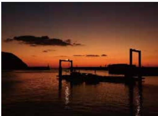
医療センター前（朝焼け）