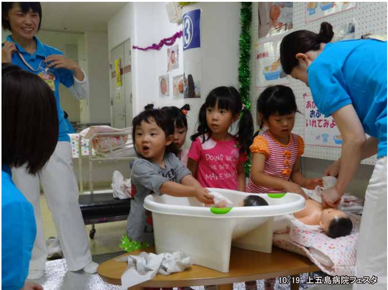
10/19 上五島病院フェスタ