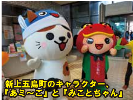
新上五島町のキャラクター、 『あみ〜ご』と『みことちゃん』