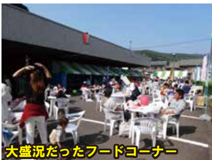
大盛況だったフードコーナー