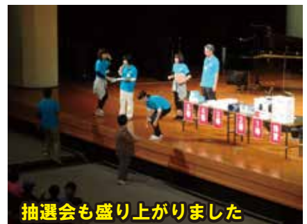
抽選会も盛り上がりました