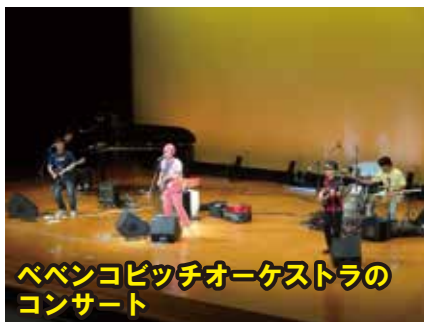
ベベンコピッチオーケストラの コンサート