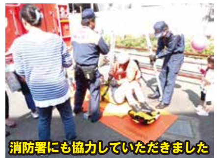
消防署にも協力していただきました