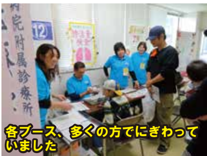
各ブース、多くの方でにぎわって いました