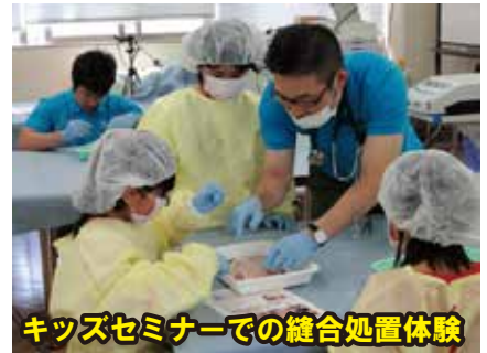
キッズセミナーでの縫合処置体験