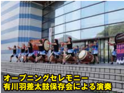
オープニングセレモニー 有川羽差太鼓保存会による演奏