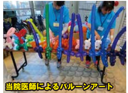
当院医師によるバルーンアート