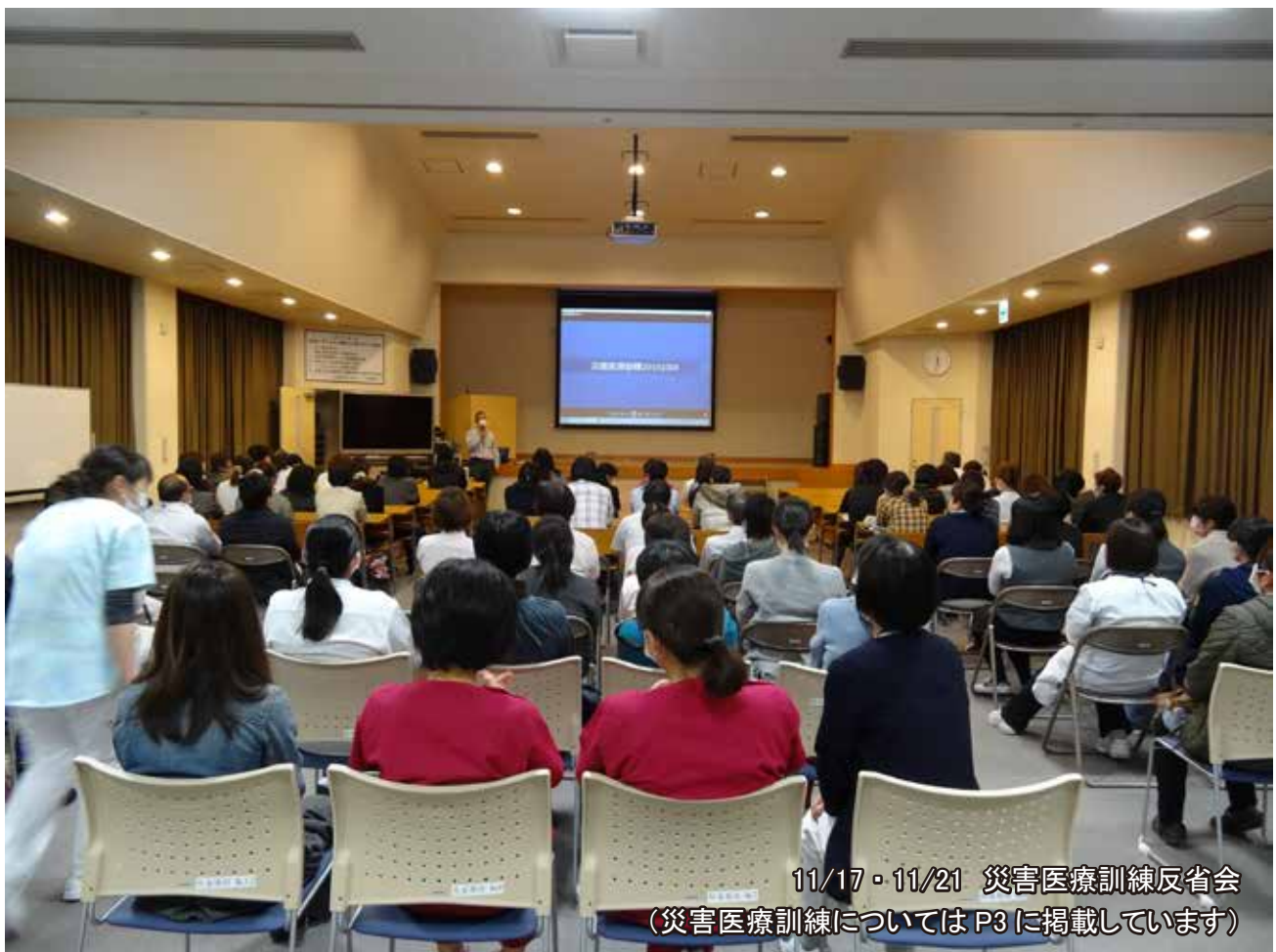
11/17・11/21 災害医療訓練反省会 (災害医療訓練については P3 に掲載しています)