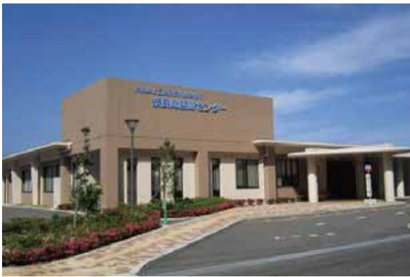
建物全景です。旧ターミナルビル手前にあります。正面玄関前にすぐ、バス停があります。

そこで、今回「かっつぽ」の紙面をお借りしまして、当センターを紹介させていただきます。次回より、部署別紹介等もしていきますので、宜しくお願いします。