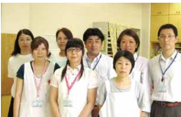
スタッフ写真（総務・医事係・他）