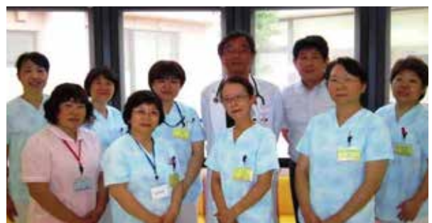
（外来・健診室・検査・リハビリ）

今後とも、地域に根ざした診療所、また住民の皆様から信頼される診療所になるよう、スタッフ一同努力していきます。どうぞよろしくお願いいたします。