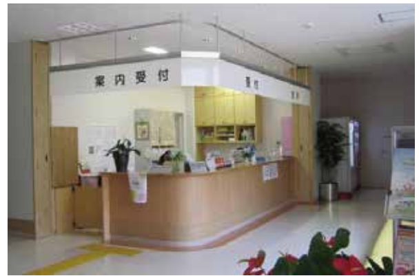
玄関すぐ横が受付になります。